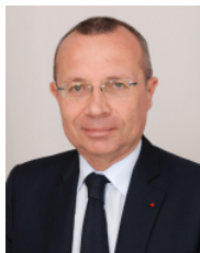
Pierre-André Durand Préfet de la région Normandie, préfet de la Seine-Maritime.

« L'épidémie du Covid-19 appelle à un redressement rapide et durable de l'économie française. À cet effet, France Relance s'articule autour de 3 volets principaux : l'écologie, la compétitivité et la cohésion. Pour accélérer cette relance tout en accompagnant les transitions écologiques, démographiques, numériques, économiques dans les territoires, le Premier ministre a souhaité dans sa circulaire du 20 novembre 2020 que chaque territoire s'inscrive dans un nouveau type de contrat : le contrat de relance et de transition écologique (CRTE).